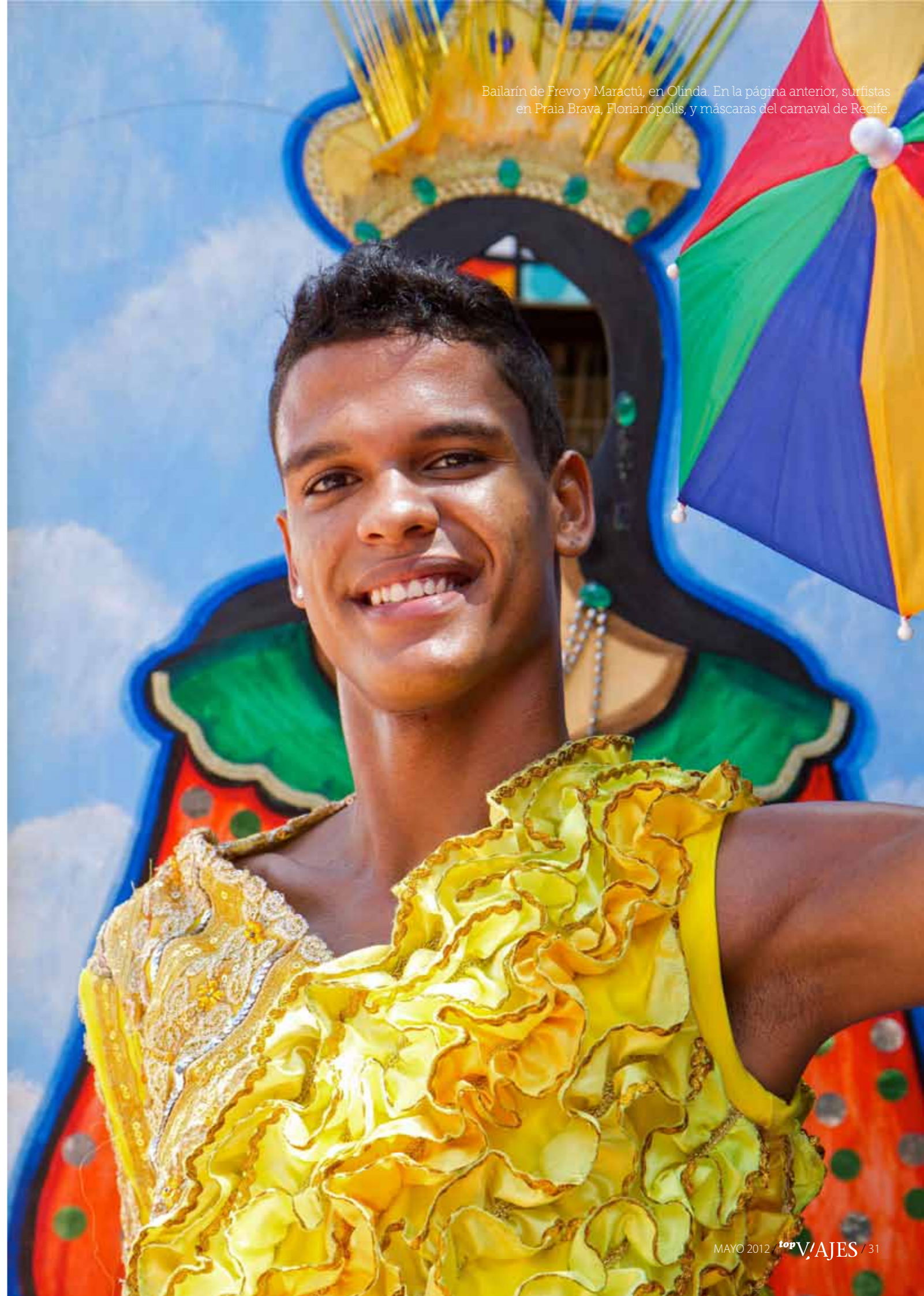
Bailarín de Frevo y Maractú, en Olinda. En la página anterior, surfistas en Praia Brava, Florianópolis, y máscaras del carnaval de Recife.

En el mes de noviembre de 2011 la revista Trip Surf Magazine -un medio dedicado a este deporte y tradicionalmente ajeno al público gay- dedicaba