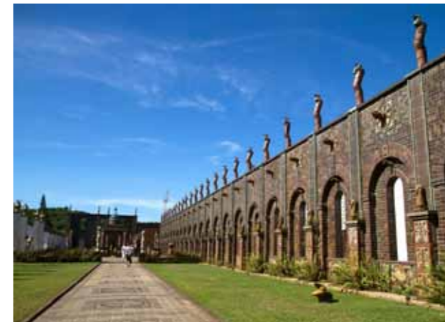
Detalle de una calle en Ilha, Florianópolis. Esculturas al aire libre en la "Oficina Brennand", de Recife

Fomentar el turismo LGTB abre un mercado con distintos perfiles de clientes y si bien es cierto que no todas las personas del colectivo desean comprar productos dirigidos a este segmento, lo que no quieren es ser excluidos. La sociedad carioca, es decir, la de Río de Janeiro, de esto sabe mucho. Desde hace muchos años la ciudad entendió que el respeto a los derechos de la comunidad LGTB y su