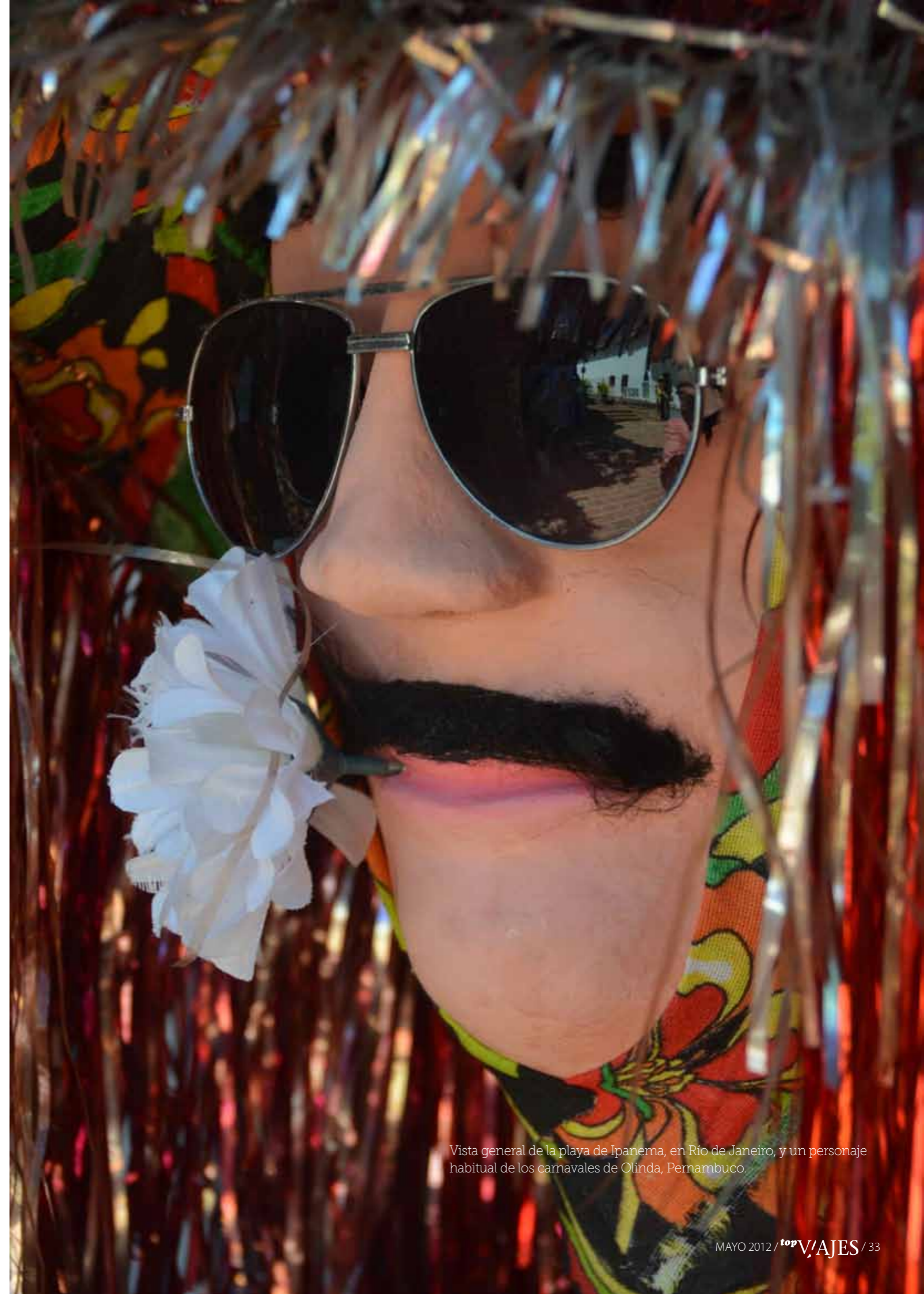
Vista general de la playa de Ipanema, en Río de Janeiro, y un personaje habitual de los carnavales de Olinda, Pernambuco.

Desde hace algunos años el carnaval de Floripa viene ganando popularidad entre el sector LGTB. En él destaca el “Bloco dos Sujos” conformado