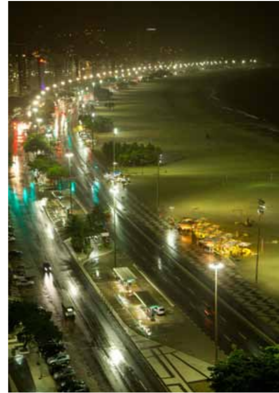
Tres imágenes de Río de Janeiro: panorámica nocturna de la playa de Copacabana, jabones de la Perfumería Granada, y vista cenital de la confitería Colombo. En la página anterior, bandera gay en la playa de Ipanema, Río de Janeiro, y típica calle de Olinda, Pernambuco.

La capital del estado de Pernambuco y motor del nordeste del país es Recife; una ciudad acostumbrada a resistir invasiones y a luchar. Su fuerza se